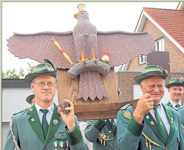
Noch als ganzes Stück, aber schon bald in vielen Teilen von der Vogelstange geholt: der Adler für das Königsschießen am Festsonntag.