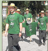
Jungschützenabschied: Mit Erreichen der Altersgrenze wechseln sie in ihre Stammkompanie.