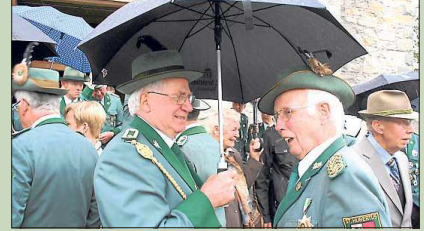
Plaudern unterm Regenschirm: Das Batenhorster Schützenfest bietet viele Gelegenheiten zum Klönen.