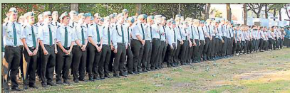
Eine stattliche Truppe: die Jungschützenkompanie der St.-Hubertus-Schützenbruderschaft Batenhorst.